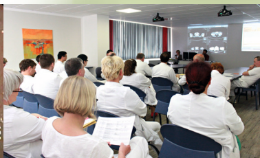
Wöchentliche interdisziplinäre Tumorkonferenz